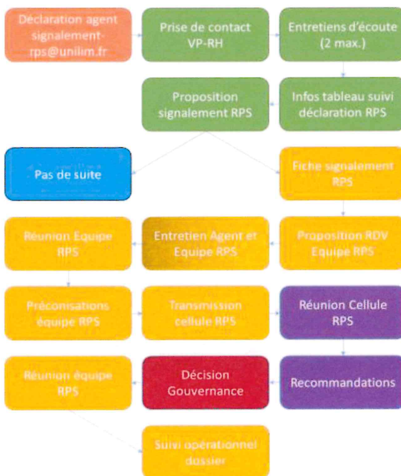
Schéma de fonctionnement du dispositif RPS

La décision finale appartient à la Gouvernance de l'université , qui met en œuvre un suivi des mesures décidées. Un bilan annuel est réalisé pour évaluer le dispositif, avec une évaluation par la FS du CSAE. La confidentialité et l'indépendance des membres de l'équipe sont essentielles (précisées dans une charte de confidentialité signée par chacun des membres).